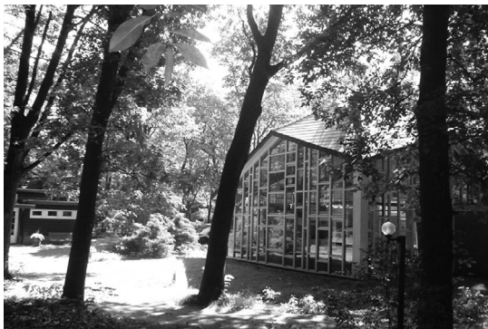
La Cristal Hall.