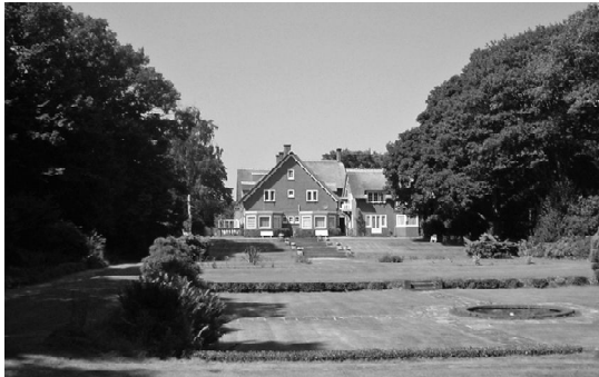
La St. Michael's House.

Attività: Il CTI vuole dare grande enfasi ad attività che siano destinate a tutto il pubblico, a