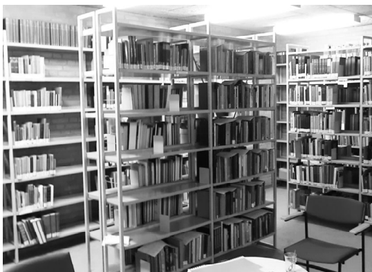
Uno scorcio della biblioteca.