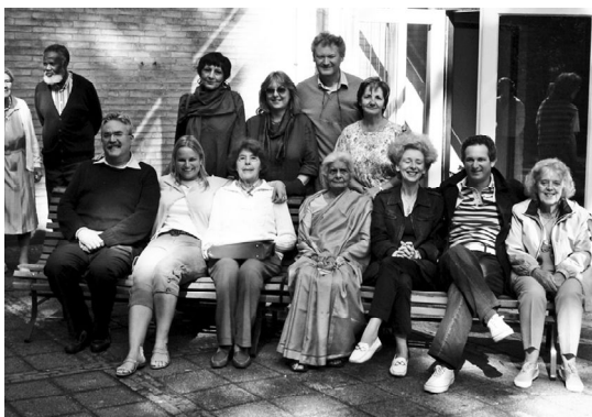
La Presidente mondiale Radha Burnier con i partecipanti italiani e ticinesi alla Scuola Estiva dei Paesi Latini 2006.